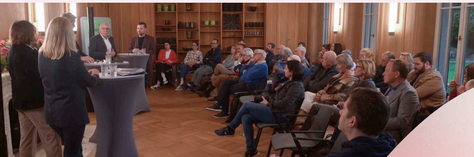
Die erste Ausgabe des Debattierparks mit dem Thema «Brennpunkt Demokratie: Medienlandschaft in der Krise?» ist auf grosses Interesse gestossen.

Dieses Angebot stärkt die pädagogischen Kompetenzen und fördert den Austausch innerhalb des Netzwerks.