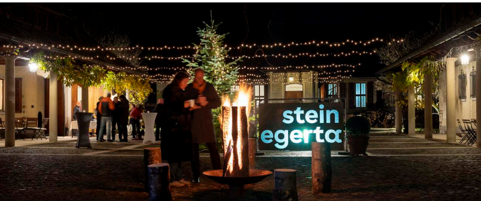
Lichterzauber: Der Innenhof der Stein Egerta verwandelte sich in der Adventszeit zu einem Treffpunkt für Begegnung und Austausch.

Seminarzentrum neben seiner klassischen Funktion als Lernort zunehmend auch an Bedeutung als Ort der Begegnung, des Austauschs und des gesellschaftlichen Miteinanders.